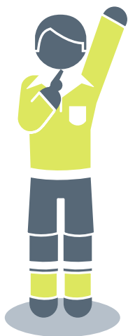
Óbeinleiðis fríspark |