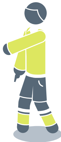
Brots spark |

Sjá tekningar fyri at síggja góðkend dómaratekn.