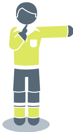
Beinleiðis fríspark |