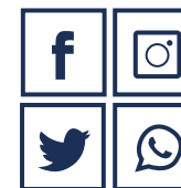
MARKNAÐARFØRING OG SAMSKIFTI